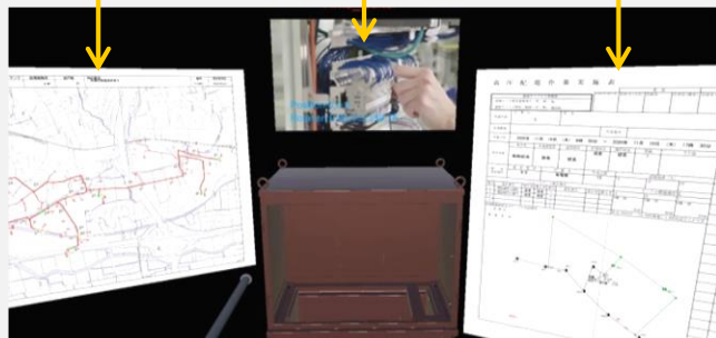
ARスマートグラスを使った作業支援(イメージ)