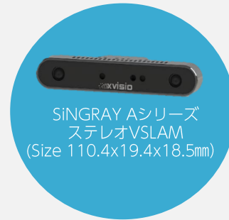
SiNGRAY Aシリーズ ステレオVSLAM (Size 110.4x19.4x18.5mm)